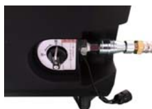
ワンタッチカップリング

注) 写真はイメージです。 実際に使用される場合は、LPガスを発電機から2m以上離してご使用ください。