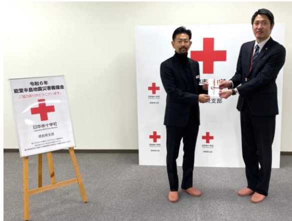
日本赤十字社 徳島県支部にて 2024年3月26日